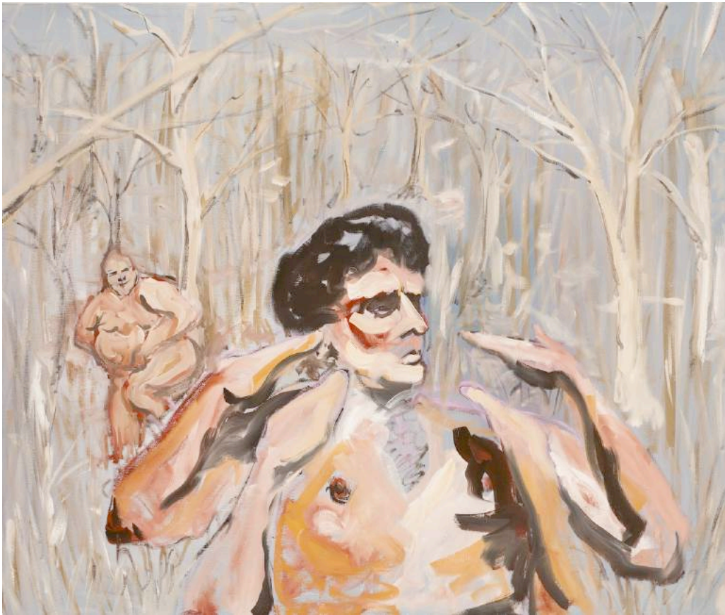
03- Christian Messier, « Animal lovers », 2017, huile sur toile, 40 x 48" / 101,60 x 121,92 cm