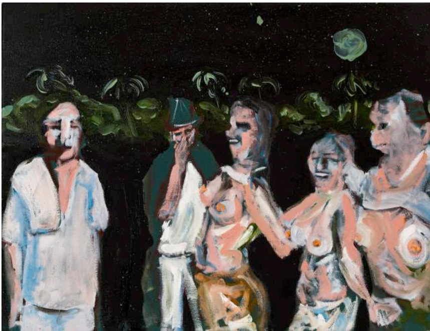
02- Christian Messier, « Pleine lune », 2016, huile sur toile, 18 x 24" / 45,82 x 60,96 cm

La Forêt s'en vient II , une exposition solo de Christian Messier présentée à la Galerie Laroche/Joncas 3 du 7 juin au 1 er juillet 2017. Vernissage le samedi 10 juin à 15 h. Table ronde le samedi 17 juin à 16 h 30. 372, rue Sainte-Catherine Ouest, #410, Montréal, Québec, H3B 1A2 – 514 570-9130 larochejoncas.com + christianmessier.ninja