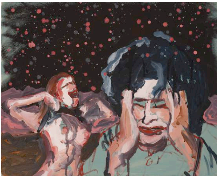
04- Christian Messier, « Le déni », 2016, huile sur toile, 16 x 20" / 40,64 x 50,80 cm

La Forêt s'en vient II , une exposition solo de Christian Messier présentée à la Galerie Laroche/Joncas 4 du 7 juin au 1 er juillet 2017. Vernissage le samedi 10 juin à 15 h. Table ronde le samedi 17 juin à 16 h 30. 372, rue Sainte-Catherine Ouest, #410, Montréal, Québec, H3B 1A2 – 514 570-9130 larochejoncas.com + christianmessier.ninja