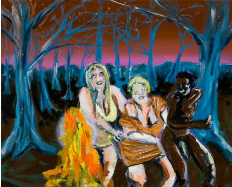
01- Christian Messier, « Paradise liebe », 2016, huile sur toile, 16 x 20" / 40, 64 x 50,80 cm

Ci-dessous : les six œuvres censurées par [co]motion / la Corporation de la salle André-Mathieu (Laval) en mars 2017