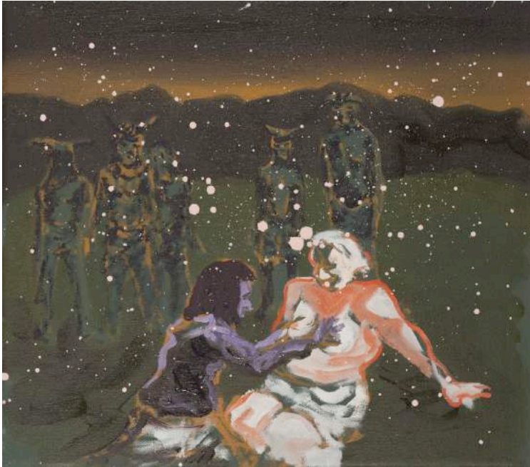
05- Christian Messier, « Amour Vaudou », 2017, huile sur toile, 15 x 18" / 28,10 x 45,72 cm