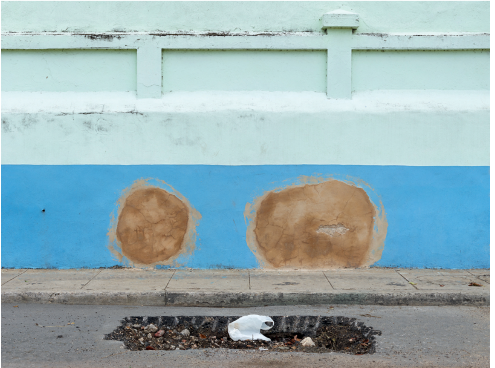
Horizon #170 (Macau), 2014, 110 × 147 cm