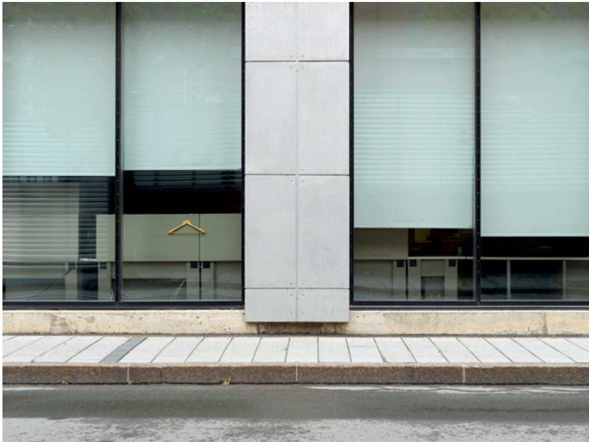
Horizon #052 (Havana), 2017, 110 × 147 cm True Nature #031 (Montreal), 2018, 20 × 27 cm