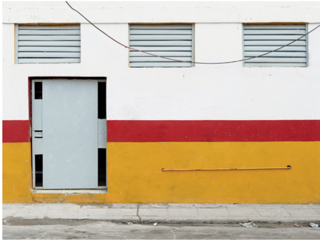
True Nature #054-069 (Havana), 2017 60 x 80 cm ea./ch.